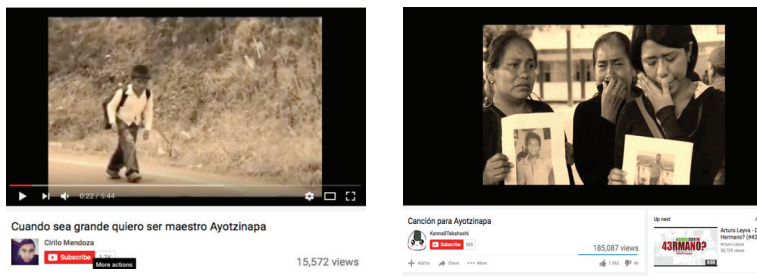
FIGURA 3 IMÁGENES DEL RELATO EN PASADO