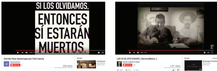
FIGURA 4 IMÁGENES DEL RELATO EN PRESENTE