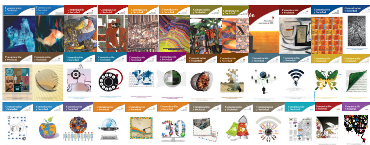
GRÁFICO 1 PORTADAS DE COMUNICACIÓN Y SOCIEDAD , 2004-2021