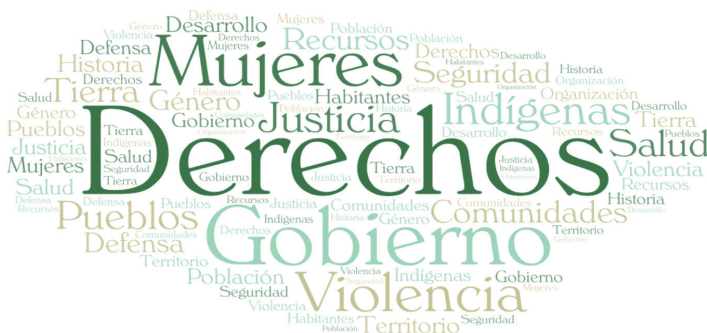
FIGURA 1 PALABRAS MÁS EMPLEADAS EN LOS TEXTOS PUBLICADOS POR LA ALIANZA DE MEDIOS EN EL PRIMER SEMESTRE DE 2019